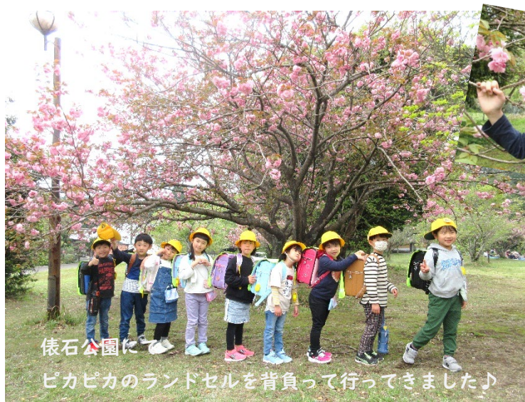
俵石公園に ピカピカのランドセルを背負って行ってきました♪

新年度が始まり、一か月が経ちました。新一年生も学校生活に慣れてきて、学童でも楽しく過ごせています。これから初めて経験することばかり。きっと失敗することもあると思いますが、あたたかく見守っていききたいものですね。