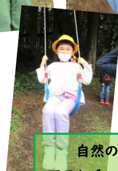
自然の中で アスレチック遊び♪