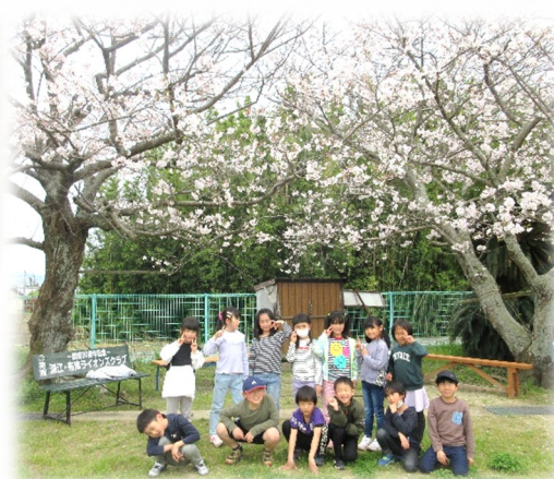
一分校でお花見♪ 桜の下で食べるお弁当 は最高!